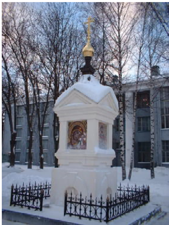
С освященной зачеткой не страшны любые экзамены!