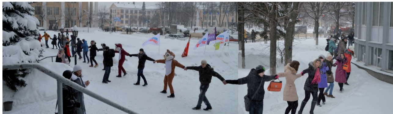
Для ненаблюдательных: герои публикации и авторами статей данного номера, посвященного Татьянинному дню, как немногие смогли заметить, являются, в основном, обладательницы красивого имени Татьяна.