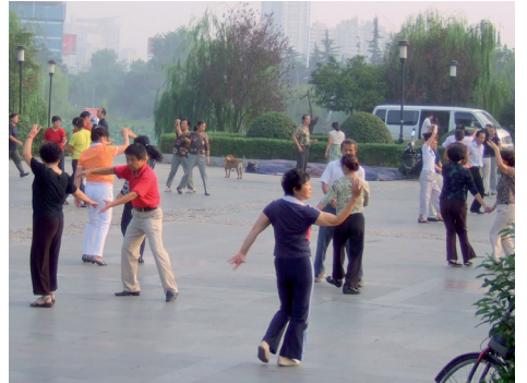
В 6 утра прямо на улице студенты занимаются у-шу или просто танцуют

матизм и особенности устной речи (на слух собеседник может не понять). Дисциплинированности нет и в помине: китайцы опаздывают всегда, независимо от статуса участников встречи. То же касается и соблюдения сроков выполнения поручений. Очень любят переносить сроки: вперед или назад – все равно, даже если все давно согласовано со множеством лиц. Трудолюбие – всегда показное, на самом деле китайцы минималисты и очень неторопливы («а вдруг поручение отменят»).