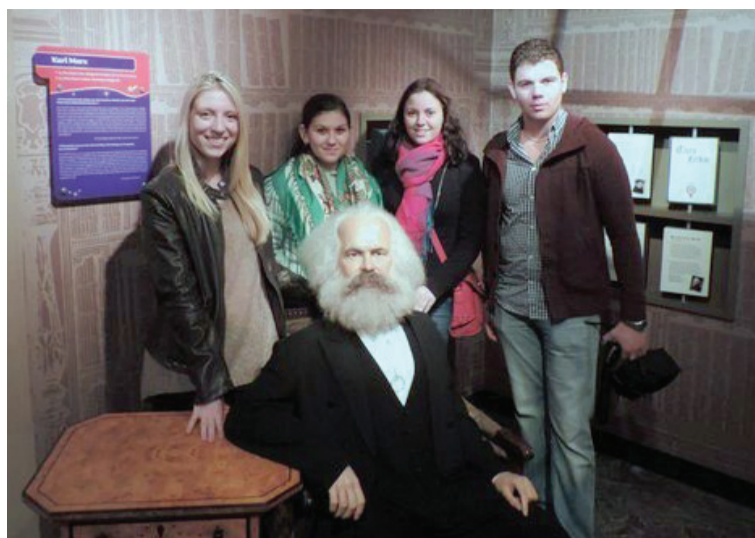
Мы в музее восковых фигур мадам Тюссо. Париж. Франция.

«Я никогда не думала, что несколько месяцев вдали от дома могут пролететь незаметно. Каждый день