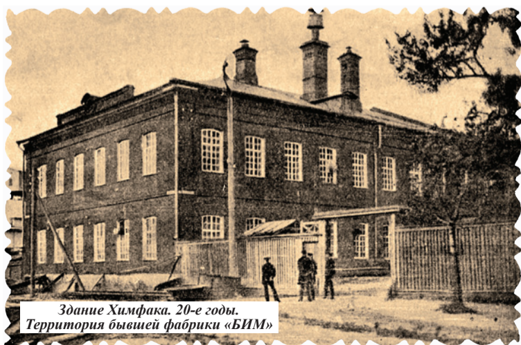
Здание Химфака. 20-е годы. Территория бывшей фабрики «БИМ»

Открывая сегодня новую рубрику, мы предлагаем перелистать страницы исторических документов и воспоминаний, хранящихся в музее вуза, увидеть события многолетней давности глазами очевидцев, вновь пройти с ними основные вехи нашего славного пути.