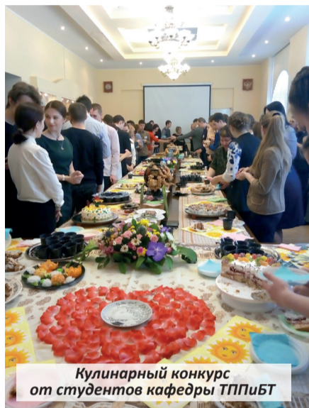
Кулинарный конкурс от студентов кафедры ТППиБТ