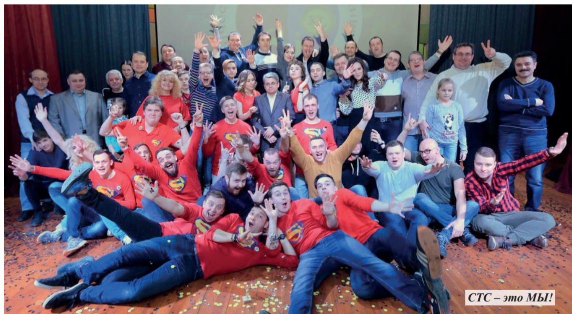
СТС – это МЫ!

Этой весной мы отмечаем наш творческий юбилей – 40 лет первоапрельских концертов СТС. Это самая известная и сильная наша традиция. Хотелось бы пожелать нашему театру молодости, как у первокурсников, мудрости, как у наших «ветеранов», и благодарных зрителей!