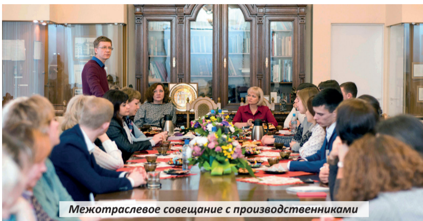
Межотраслевое совещание с производителями