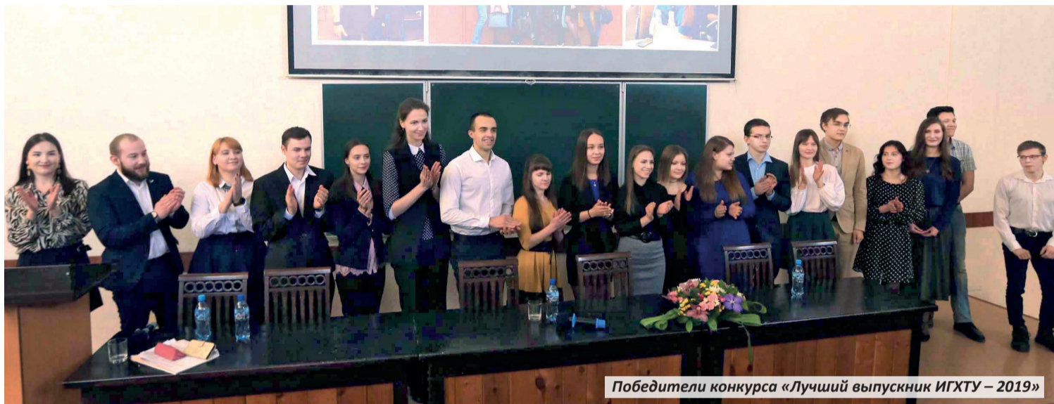
Победители конкурса «Лучший выпускник ИГХТУ – 2019»