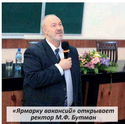
«Ярмарку вакансий» открывает ректор М.Ф. Бутман