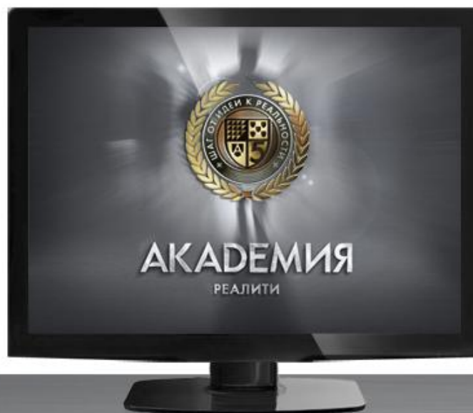
«АКАДЕМИЯ реалити» телевизионный проект