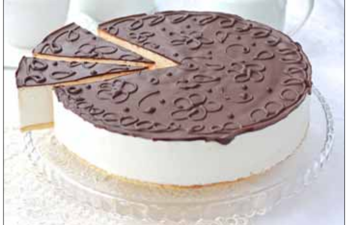
Конкурс «Новогодние рецепты» проводится до 25 декабря. Принесите рецепты и фото ваших блюд по адресу: ул. Степанова, 5, кабинет № 9, или присылайте на электронную почту: lyo2009@mail.ru . Магазин «Унидом» готов вручить лучшему кулинару набор посуды.