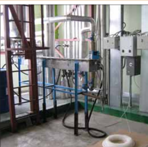
Так выглядит полиамидное волокно, на основе которого производится корд для автомобильных шин самого широкого спектра: легковых, грузовых, сельскохозяйственных, общественного транспорта, а также шасси самолетов и другой авиационной техники.

российский химик, специалист в области синтеза, изучения физико-химических свойств и практического использования порфиринов, металлопорфиринов, их структурных аналогов и жидкокристаллических соединений, ректор (до 2014 года, ныне президент. - Прим. ред.) Ивановского государственного химико-технологического университета. Действительный член Академии инженерных наук России им. А.Н. Прохорова, заслуженный деятель науки Российской Федерации (1996). Добавим: председатель экспертного совета ВАК по органической химии, заведующий лабораторией Института химии растворов имени Г.А. Крестова РАН, главный редактор журналов «Макрогетероциклы», «Российский химический журнал» и заведующий кафедрой химии и технологии высокомолекулярных соединений ИГХТУ.