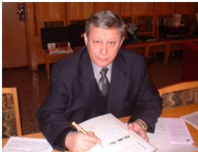
ФОТО ПРЕПОДАВАТЕЛЕЙ КАФЕДРЫ

д. х. н., профессор. Член- корреспондент РАН. Лауреат премий Правительства РФ в области науки и Президента РФ в области образования. Ректор ИГХТУ.