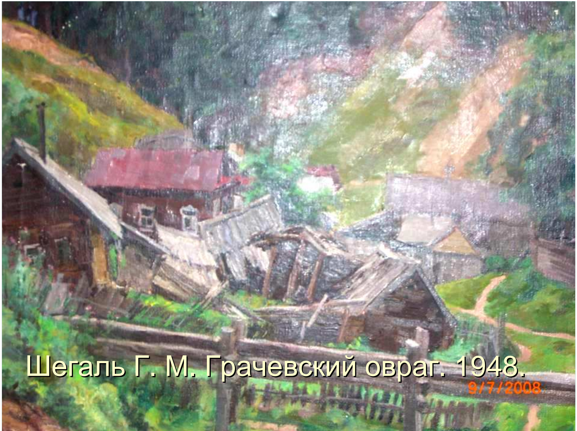
Шегаль Г. М. Грачевский овраг. 1948.