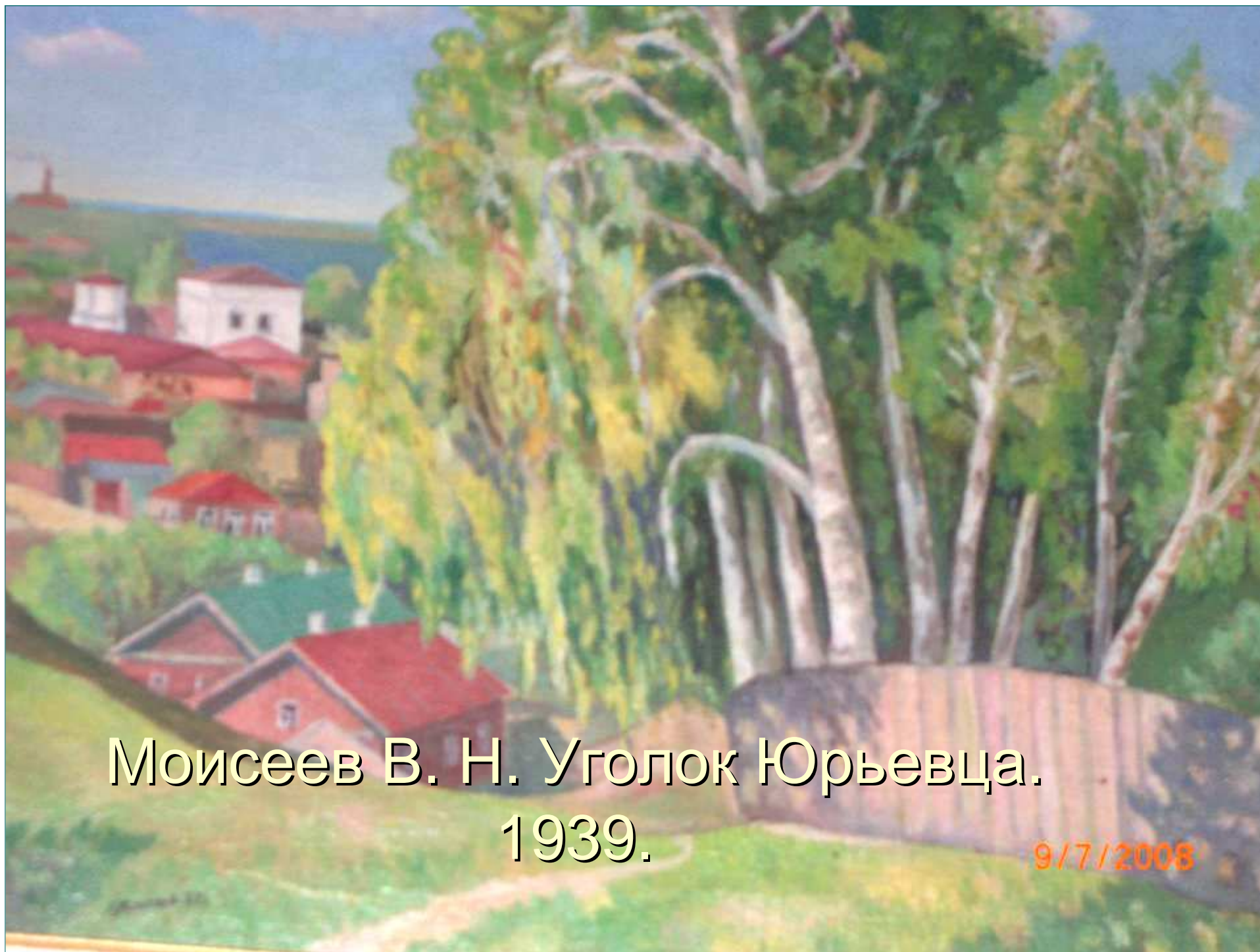
Моисеев В. Н. Уголок Юрьевца. 1939.