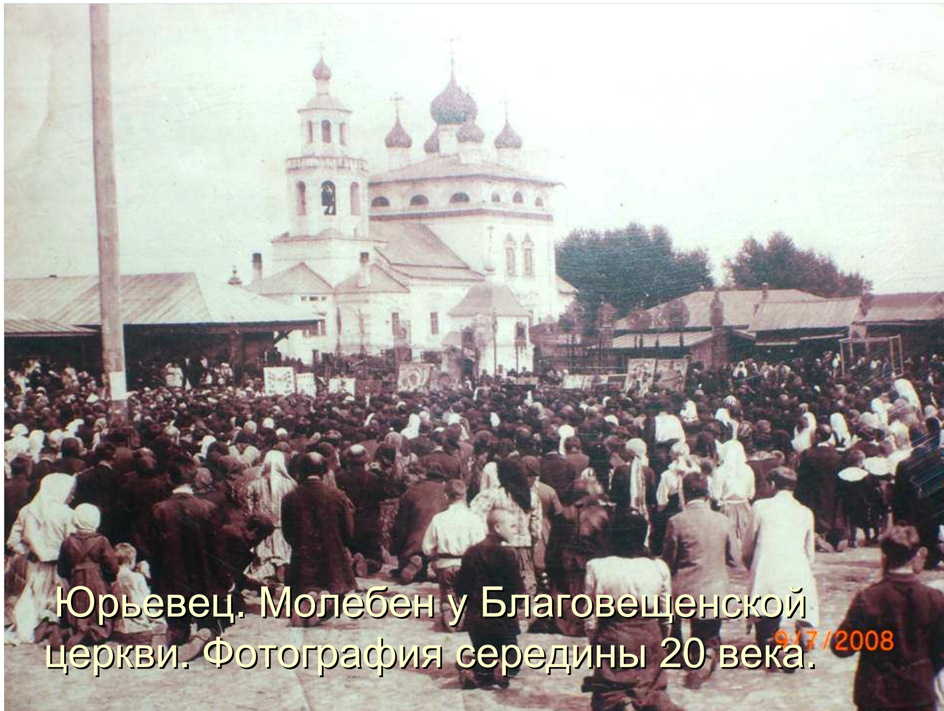
Юрьевец. Молебен у Благовещенской церкви. Фотография середины 20 века.