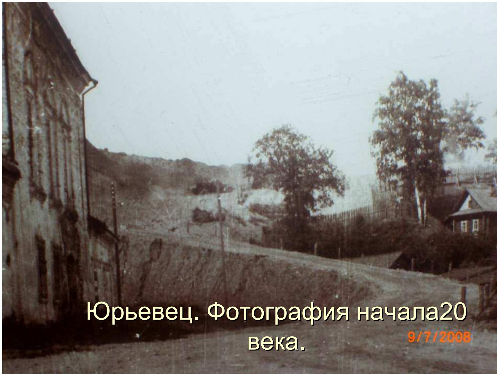
Юрьевец. Фотография начала 20 века.