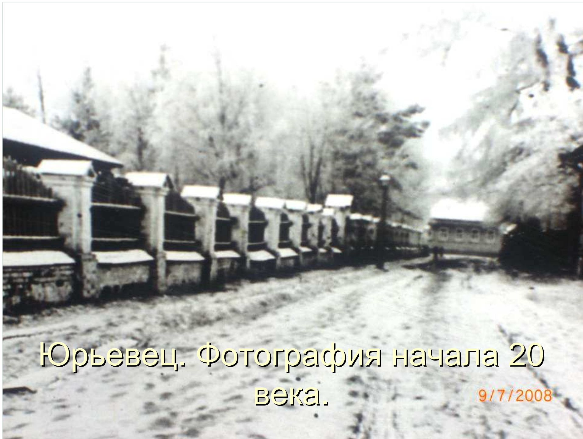
Юрьевец. Фотография начала 20 века.