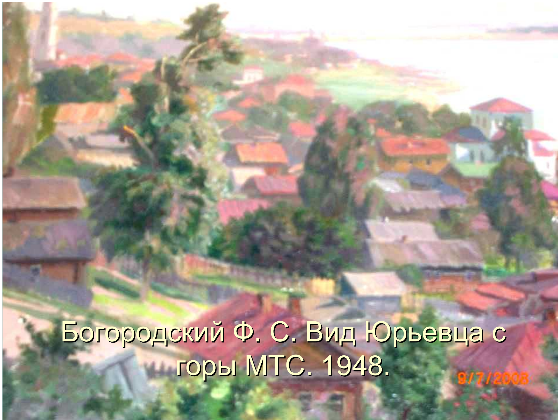
Богородский Ф. С. Вид Юрьевца с горы МТС. 1948.