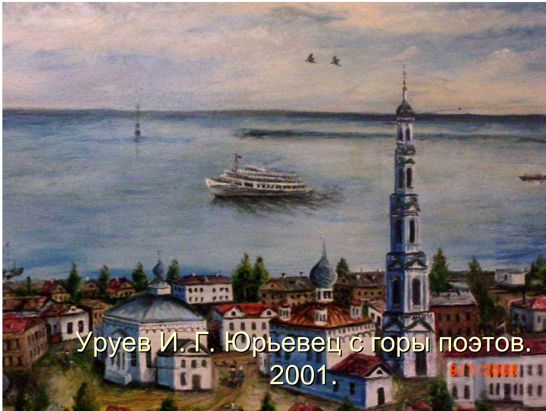
Уруев И. Г. Юрьевец с горы поэтов. 2001.